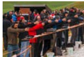
Pistolenschützen in Schützenlinie