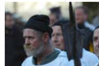
Die «Alten Schwyzer»