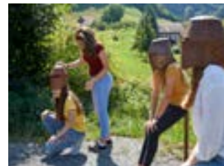
Auf den Spuren der Schlacht