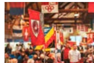
Schützengemeinde in der Morgartenhütte