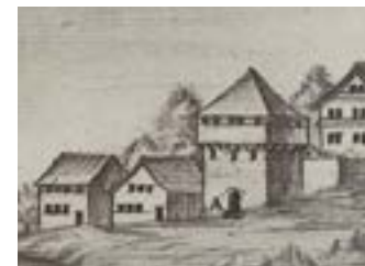
Wachturm in Arth mit hölzernem Obergaden (Schützenlaube)