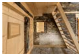
Einblick ins Innere des Hauses