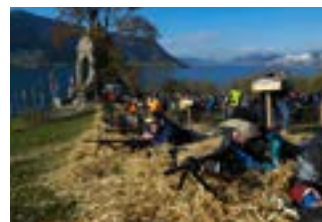
Schützenlinie oberhalb des Denkmals

Der Schütze oder die Schützinzin mit dem höchsten Einzelresultat wird «Morgarten-Meisterschütze» und gewinnt die vom Bundesrat gestiftete Ehrengabe. Abschluss bildet die Schützengemeinde in Morgartenhütte mit Rangverkündigung und einer politischen Ansprache.