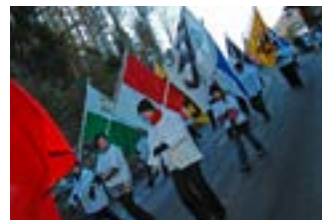
Schulkinder mit Kantonsfahnen

In einem feierlichen Zug marschieren Vertreterinnen und Vertreter aus Politik, Armee, Kirche, Wirtschaft und Verwaltung zusammen mit militärischen Formationen, historischen Gruppen, Vereinen, Organisationen, Musikkorps, Schulkindern, Fahnen vom Dorf Sattel zum Feierplatz bei der Schlachtkapelle im Weiler Schornen. Mit dem Verlesen des Schlachtbriefes beginnt die Andacht zum Gedenken an die Gefallenen. Eine politische Rede bildet den Abschluss der schlichten Feier. Der Rückmarsch nach Sattel führt zum gesellschaftlichen Teil mit einem öffentlichen Apéro und dem gemeinsamen Mittagessen aller Beteiligten.