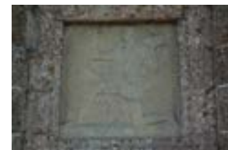
Relief unter der Inschrift