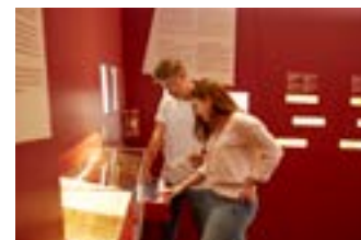
Informationszentrum beim Letziturm