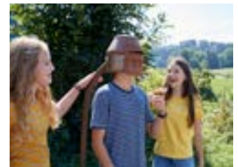
Ritterhelm zum Anfassen und Anprobieren