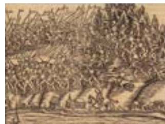
Holzschnitt der Schlacht