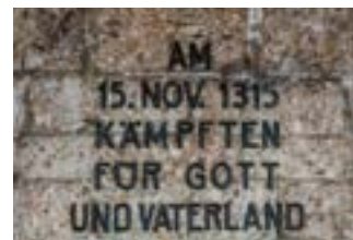
Inschrift am Denkmal

Als «Denkmal» auf der Schwyzer Seite gilt die 1501 erstmals erwähnte Schlachtkapelle. Über dem Portal ist das heutige Gebäude mit 1603 datiert. Das 1957 von Maler Hans Schilter geschaffene Wandbild «Aufmarsch zur Schlacht» zeigt spannungsvoll den unmittelbaren Moment vor der Schlacht. Im Kapellinnern finden sich Standesscheiben des Bundes und der Urkantone, sowie Bilder der 14 Nothelfer.